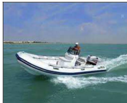
Embarquement – Débarquement